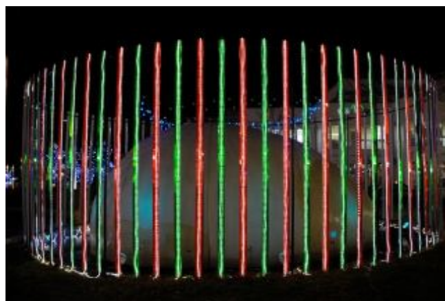
図 2: 左目用