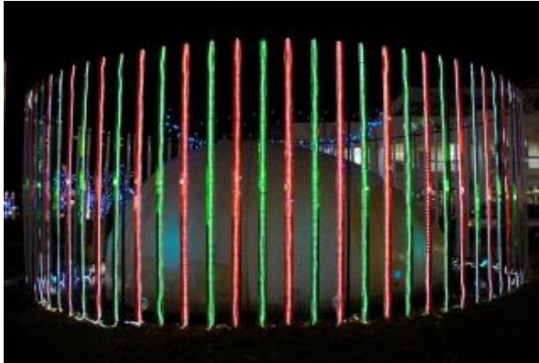
図 1: 右目用