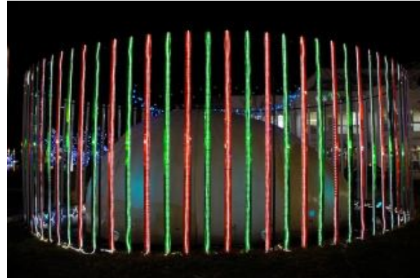
図 2: 左目用