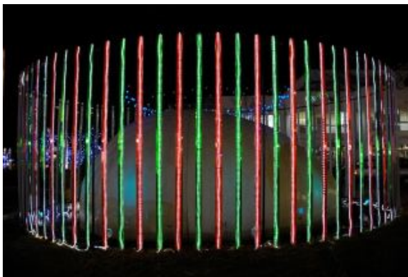
図 1: 右目用