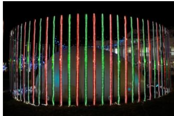
図 3: 左目用